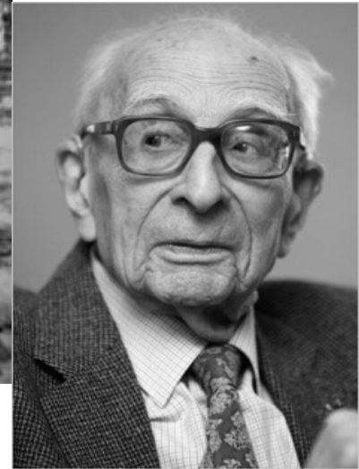
Claude Lévi-Strauss (1908 – 2009) Brasilien 1930/Frankreich 2008